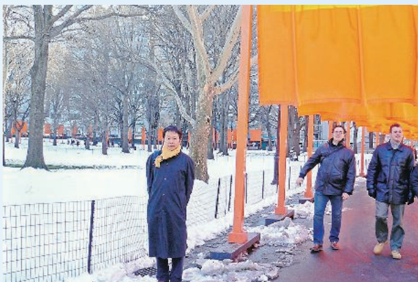
東京地裁右陪席時代 NY 出張

【垣内】そうですね。鹿児島地家裁名瀬支部での2年間は、本当に貴重な経験でした。裁判官が1人だけの「1人支部」で、民事、刑事、家事、少年、破