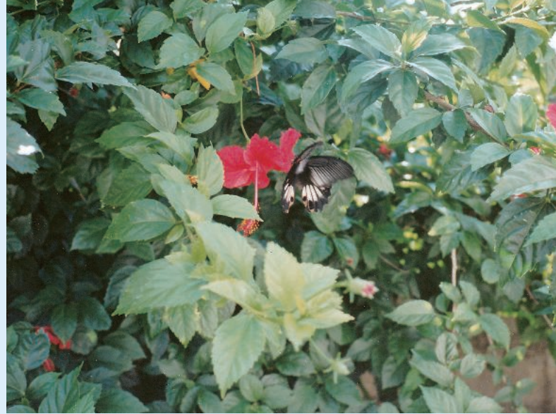
宿舍の庭のハイビスカスと蝶

産、執行など全ての事件を1人で担当しました。刑事の合議事件は、鹿児島地裁本庁から2人の裁判官が出張してきてくれるのですが、それ以外は全て1人です。