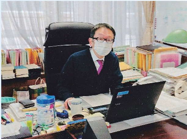
東京地裁所長時代 コロナ禍の執務室