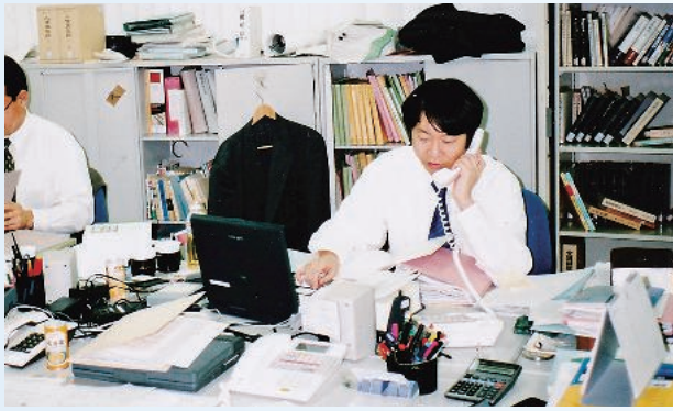
預金保険機構時代 執務室

方々とのお付き合いもして、外から裁判がどのように見えているのかも教えてもらって、勉強になりました。預金保険機構へ出向した当時は、ちょうど、住専問題解決のために機構が発足したばかりでした。官民様々な母体からの出向者が集まっていて、初めてのことばかりで貴重な経験でした。