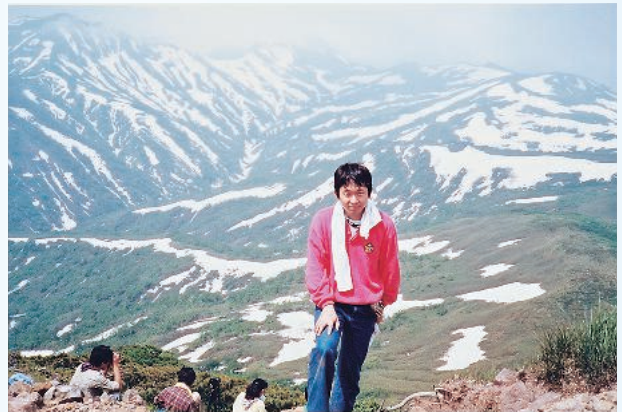
初任の札幌地裁時代 旅行会

【垣内】 裁判には、私人間の紛争を解決する「民事裁判」と、罪を犯したと疑われている人について、罪を犯したかどうか、犯したのであればどのような刑罰を科するかを決める「刑事裁判」とがあります。重い事件は「合議事件」と言って3人の合議体で審理し判決をします。それほど重くない事件は「単独事件」と言って、1人の裁判官で審理し判決をします。所定の刑事事件については、国民から選ばれた