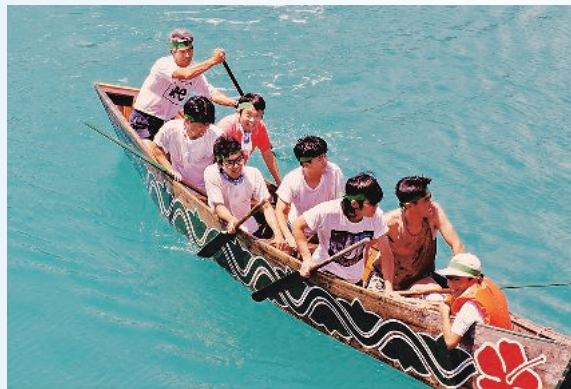
夏祭りの船漕ぎ競争