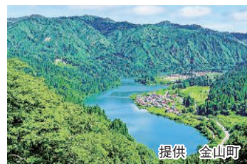
大志集落（金山町）と只見川